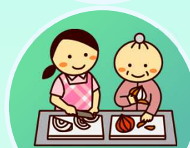
調理・調理手伝い