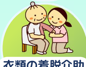
衣類の着脱介助 身体整容